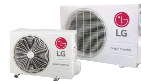
LSU090HSV5 et LSU120HSV5