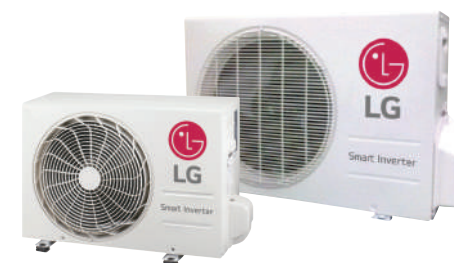
LSU090HSV5 et LSU120HSV5